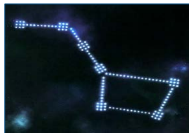
Gesticktes Sternbild auf einem Vorhang