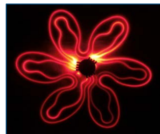
Aus LWL gestickte Blüte