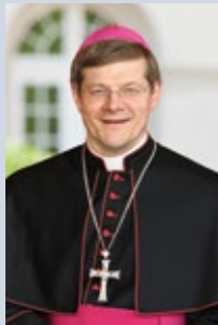
Stephan Burger Erzbischof der Erzdiözese Freiburg