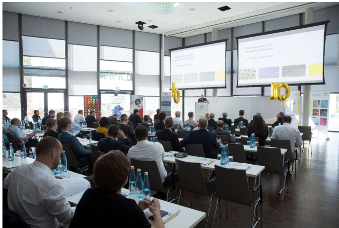
Bildunterschrift: Interner Teil der AFBW Mitgliederversammlung